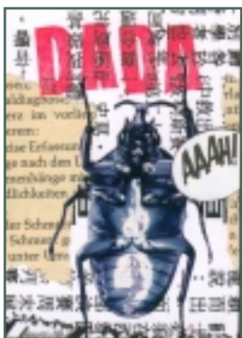
Artists Trading Card 63 x 88 mm méretű művészártyák a baseball- és kosárlabdakártyák mintájára. Cserék, kollektív csomagok és vándorkiállítások tárgya.