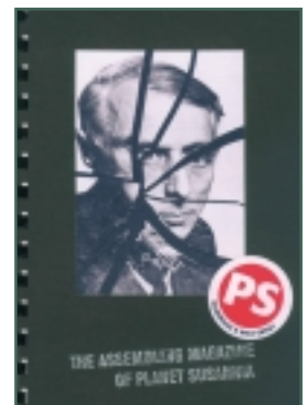
▲ Assembling Magazine „22” 22 művész eredeti, számozott és szignált lapjaiból készült unikát kiadvány. Az alkotók eredeti példányt kapnak a kötetből.